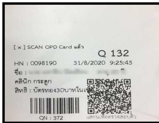
บัตรคิวส่วนที่ 1

ส่วนที่ 2 ยื่นให้กับพยาบาลประจำแผนก ส่วนที่ 2 ประกอบด้วยข้อมูลดังภาพ