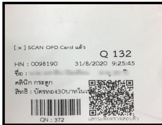
บัตรคิวส่วนที่ 1

ส่วนที่ 2 ยื่นให้กับพยาบาลประจำแผนก ส่วนที่ 2 ประกอบด้วยข้อมูลดังภาพ